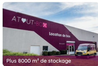
Plus 8000 m 2 de stockage